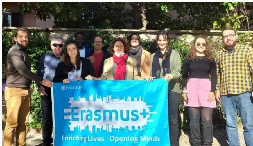
Transnational Kick-off partnership meeting in Rome, November 2021

DigiGuide combina il convalidato metodo dei Casi di Studio con una nuova dimensione digitale e mira a massimizzare il potenziale dell'apprendimento interattivo, mantenendo l'alto valore di scambio, interazione e identificazione che è stato il punto di forza dei precedenti progetti Guide. Scopri di più nel nostro sito web del progetto